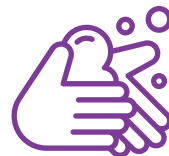
Nombreux points d'eau avec savon